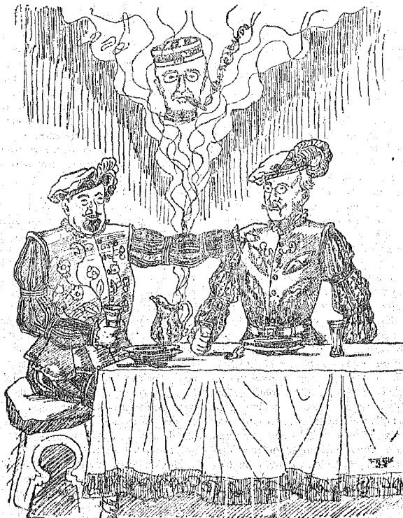
UNA CENA CLASICA

—Y al mirar sin él la mesa, me da en verdad pesadumbre.